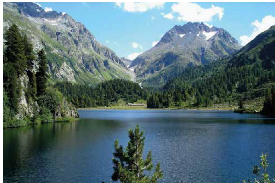
Lagh da Cavloc GR